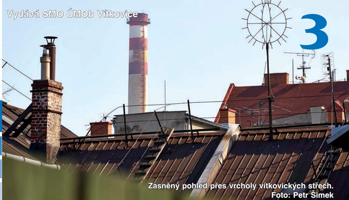
Zasněný pohled přes vrcholy vítkovických střech.