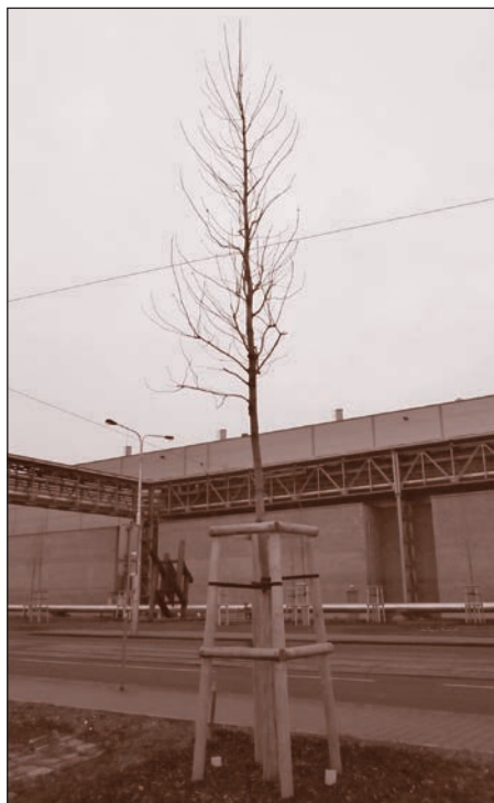
Půvab stromů vysazených díky projektu Zelená osa Vítkovic bude více patrný až za několik let.

Také vedení našeho obvodu se dlouhodobě snaží pečovat o Vítkovice, a tím pozitivně přispívá ke zvyšování kvality životního prostředí jako celku. Rekonstruuje budovy, komunikace i chodníky, podílí se na výsadbě zeleně. To všechno jsou kroky směřující jak k větší čistotě ulic a zvýšení komfortu bydlení ve Vítkovicích, tak ke zlepšení kvality životního prostředí. Na-