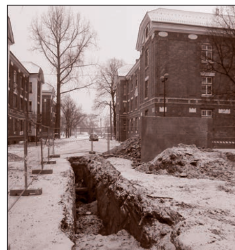
Snímek Sirotcí ulice je důkazem toho, že v lednu zde byla zahájena rekonstrukce kanalizace, i toho, že sníh padal i během letošní teplotně nadprůměrné zimy.