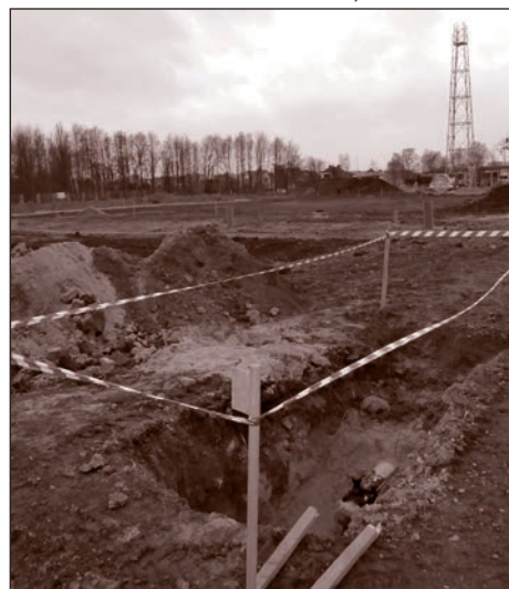
Základy sportovního areálu v ulici U Cementárny jsou už položeny.

„Budu-li nejprve hovořit o objektech a stavbách, které by měly přispět ke zkvalitňování života ve Vítkovicích, mohu zmínit